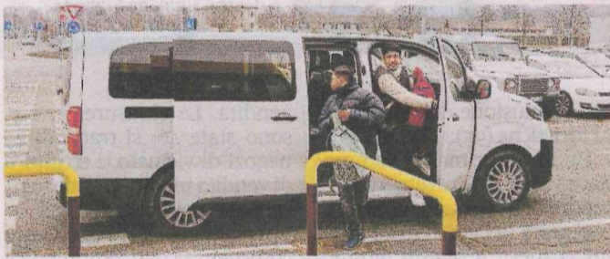
È stato predisposto il trasporto per un gruppo di giovani stranieri.

Un percorso che ha dovuto fare i conti con le criticità logistiche, linguistiche e di integrazione, ma che si sta concludendo con ottimi riscontri. La particolarità è che sono state trovate soluzioni a